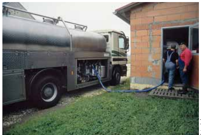
Der Kampf um die Milch wird härter. Manche Molkereien scheinen einen Milchabfluss mit „Einschüchterungen“ unterbinden zu wollen.

kereiführung, sie aus der Genossenschaft umgehend auszuschließen. Zudem werden alle 29 beschuldigt, die Molkerei bei den Konsumenten in ein sehr schlechtes Licht gerückt zu haben. Zudem wird festgehalten: „Sicher ist jedoch, dass diese Vorgangsweise zukünftig im Vorstand der Tirol Milch bei einem Ansuchen um Wiederaufnahme der Mitgliedschaft ein wesentliches Kriterium sein wird. Laut Satzung kann der Vorstand ein Ansuchen um die Mitgliedschaft ohne Angaben von Gründen ablehnen“. Eine Kampfansage, auf die die Betroffenen mittels Entgegenschreiben reagierten: Man wolle sich selbst um die Vermarktung der Milch kümmern, weil man mit einem Erzeugermilchpreis von 31,16 Cent inkl. aller Zuschläge im 1. Halbjahr 2007 nicht mehr existieren könne. Mittlerweile trafen tirolweit Glückwünsche ein, da man mit dem Schritt das Monopol der Tirol Milch gesprengt habe und endlich der „Freie Markt“ eröffnet wurde. Nur deshalb sei es wohl zu Nachzahlungen an die verbliebenen Lieferanten gekommen. Die vorsätzlich unrichtigen bzw. falschen Aussagen im Molkereibrief würden aber niemandem dienen. Zudem wird betont, dass man bis zum letzten Tag gegenüber der Tirol Milch vertragstreu bleibe. Abschließend wird eine vernünftige Gesprächskultur von Seiten der Molkerei eingefordert. – sp –